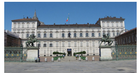
Palais Royal