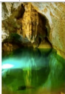
Grotte de Troubat