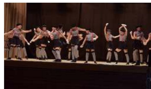
↗ En bretelles et béret, les élèves des Ateliers danse de Troistorrents ont offert au public un extrait de leur spectacle.