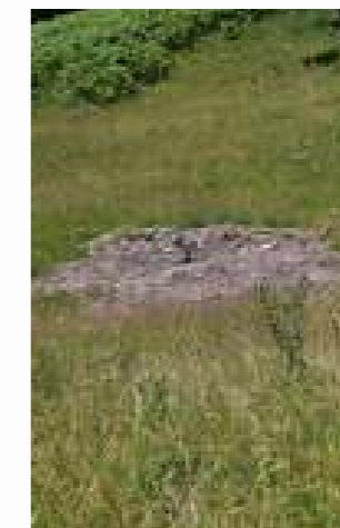
^ Lorsqu'il n'y a pas de sapins dans la zone, les forestiers-câbleurs construisent des mâts et fixent les câbles au sol à l'aide d'une pelle mécanique.