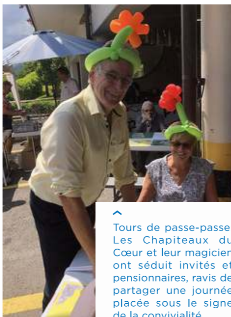
Tours de passe-passe: Les Chapiteaux du Cœur et leur magicien ont séduit invités et pensionnaires, ravis de partager une journée placée sous le signe de la convivialité.