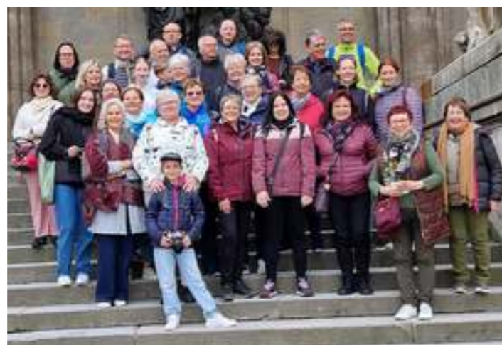
Le chœur Chante-Vièze en voyage à Munich en mai dernier.

Raclettes de la vallée d'Illeiez, gâteaux et boissons sur place. Chapeau à l'entrée.