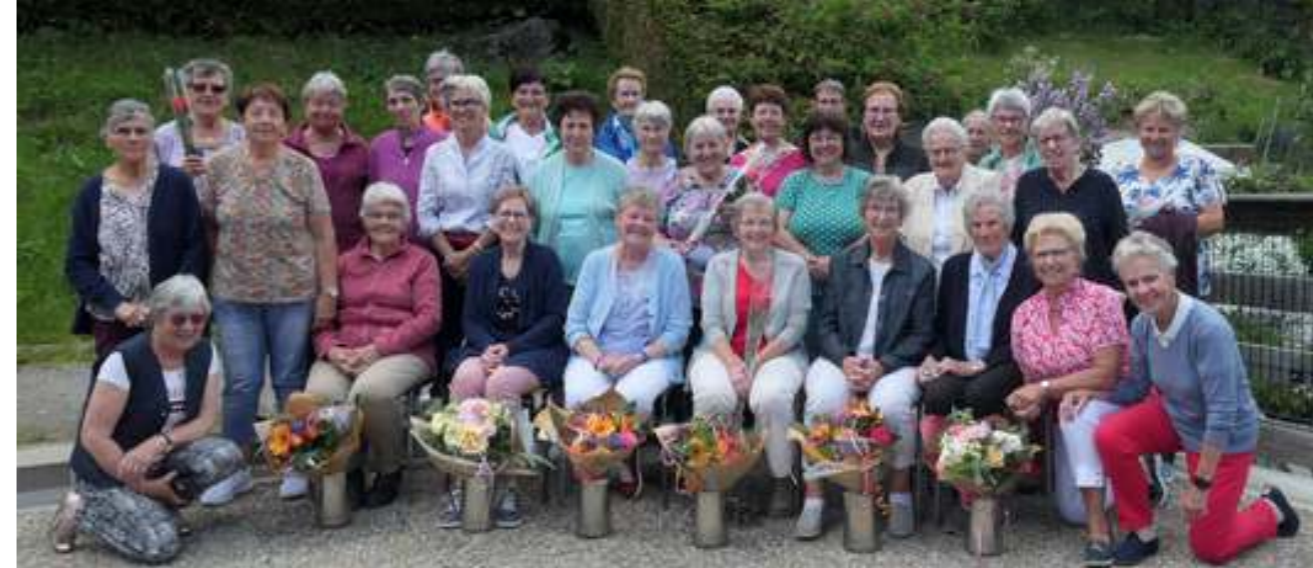
Les membres de la gym senior se sont retrouvés le temps d'un week-end.

Nous sommes à la recherche de membres. Si vous aimez chanter dans une ambiance familiale, empreinte de simplicité et d'amitié, rejoignez-nous. Pour tout contact, adressez-vous à l'un d'entre nous ou appelez le 079 746 78 66.