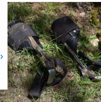
^ Pour escalader les arbres, les collaborateurs s'équipent d'un harnais et de grimpettes.