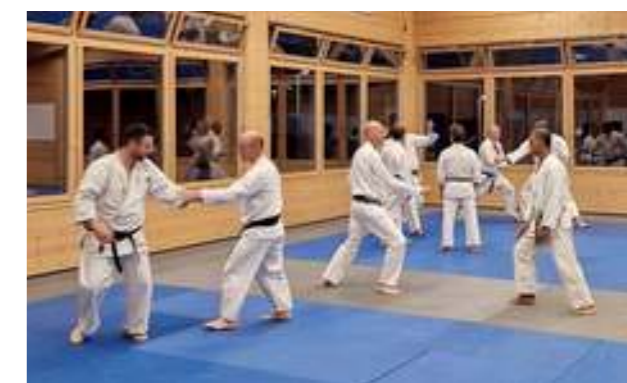
Ne vous y trompez pas: le karaté ne s'adresse pas qu'aux hommes. Les enfants, les adolescents et les femmes sont les bienvenus.

Horaires et tarifs sur : www.karate-troistorrents.ch