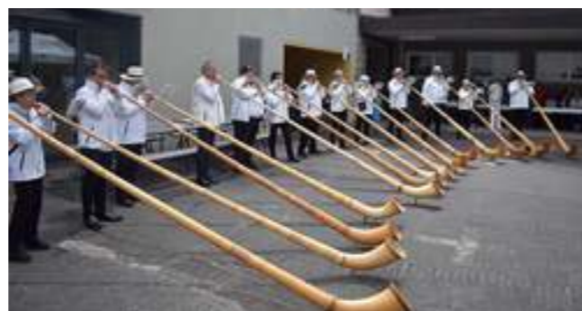
↗ Honneur aux traditions suisses: à deux reprises, l'Académie suisse de cor des Alpes a fait vibrer le public.