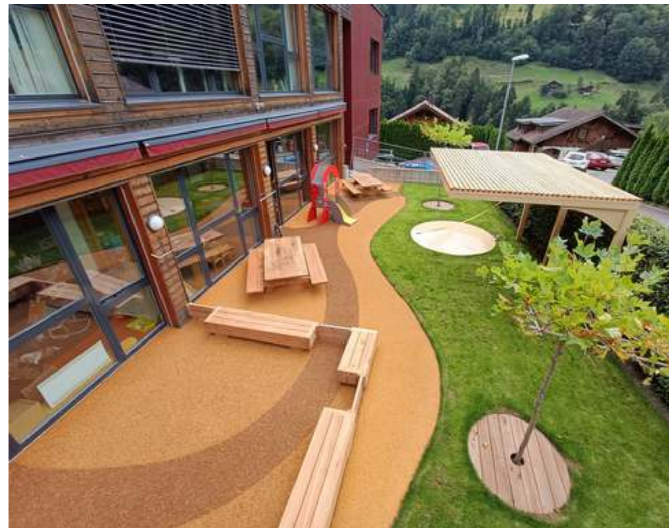
Des espaces extérieurs sûrs, spacieux et bien aménagés: les travaux du Parachute sont terminés.

Depuis la rentrée estivale, enfants et équipe éducative bénéficient d'un nouveau jardin.