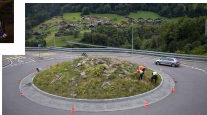
La Commune favorise la biodiversité, à l'exemple du rond-point de la Tine. Pour que ces espaces deviennent de belles prairies fleuries favorables à la petite faune, une à deux années sont nécessaires. Dans l'intervalle, seules les plantes néophytes sont arrachées, comme en août dernier. La patience est de mise...