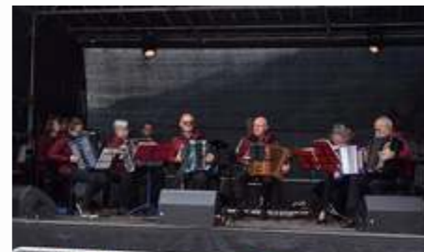
↗ Bonne ambiance garantie: depuis plus de 30 ans, L'Echo des Torrents, la société d'accordéonistes de la vallée d'Illiez, réunit les passionnés de musique.

Dimanche 1 er octobre prochain, les conteuses de l'Association Ôcytô prennent le train. Pour les écouter, deux possibilités: rendez-vous à la gare AOMC de Collombey pour un départ à 16h25 et un retour à 18h41 (fin des contes à 19h30) ou directement à la gare de Troistorrents entre 17h15 et 18h15. Une manière originale de célébrer la première année de CommUne Histoire, qui propose des contes à deux voix et en deux langues dans les communes de la région. Entrée libre, billets de train offerts, sans inscription. La manifestation est soutenue par le Programme cantonal de l'intégration du Canton du Valais. Pour en savoir plus: www.ocyto.ch