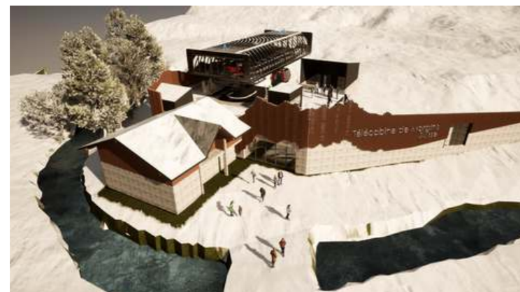
Image de synthèse de la station aval de La Foilleuse

Si vous souhaitez consulter l'avancement du dossier, tous les détails sont disponibles à la page d'accueil, sur le site internet www.pds-ch.ch , sous la rubrique « Projets 2023 ».