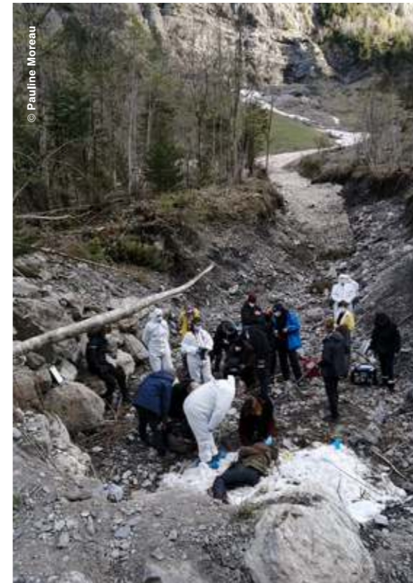
^ Scène du crime au Champ de Barme

Au terme de trois mois de travail intense, il n'y a pas que l'équipe de la série, soit près de quarante personnes ayant séjourné sur place