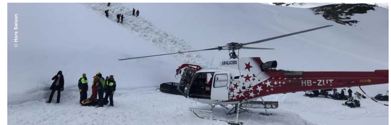
^ Tournage séquence avalanche aux Crosets