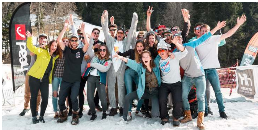
Le groupe de jeunes morginois «Morgins Young Events»

Pour les informations concernant « Splash Your Mountain » et pour acheter vos billets, vous pouvez vous rendre sur http://splashtourmountain.com .