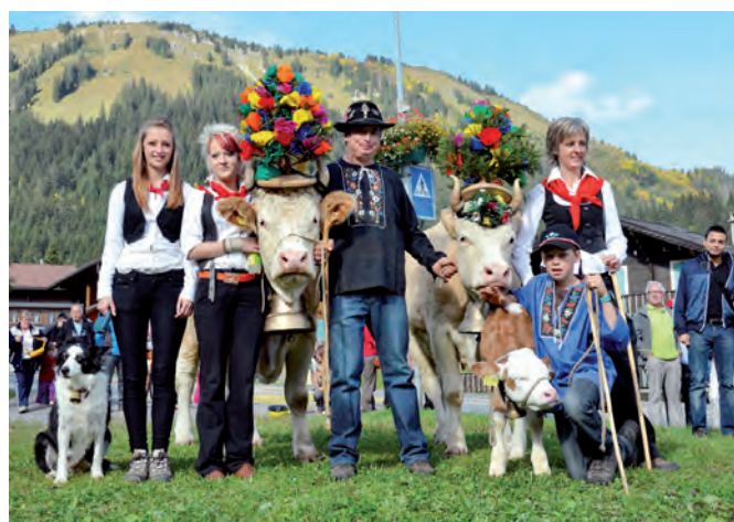
Passage du troupeau de Fécon – Famille Premand

L'automne arrive, le temps pour les troupeaux de redescendre en plaine, mais pas avant un dernier tour de piste! Rendez-vous samedi 4 octobre à Morgins pour la fameuse Désalpe, une journée riche en saveurs et en bons moments à partager. L'occasion aussi de rencontrer quelques paysans d'alpages morginois et de déguster les bons produits de notre terroir. Différents exposants viennent également présenter leur savoir-faire. Un menu spécial est proposé et une buvette est à disposition du public.