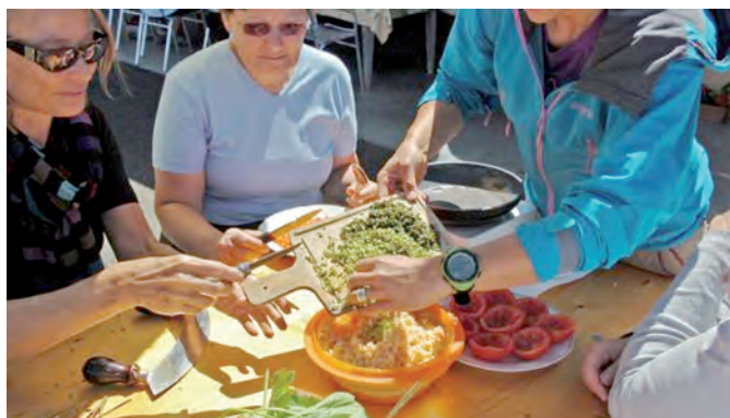
Atelier cueillette et cuisine de plantes sauvages

Vous préférez la version papier? Le programme complet est à disposition tous les 15 jours à l'Office de Tourisme, dans les commerces de la station et de Troistorrents.