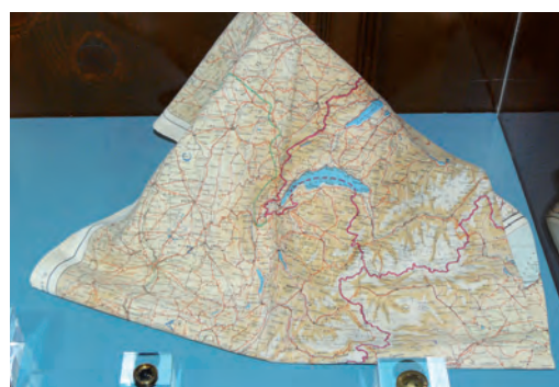
Carte en soie et boutons-boussoles de la Royal Air Force