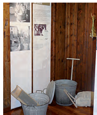
La corvée de lessive