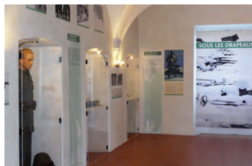
Sous les drapeaux

Le château de la Porte du Scex (16 e s.), qui abrite le Musée, mérite une visite en soi. Belles salles boisées et voûtées.