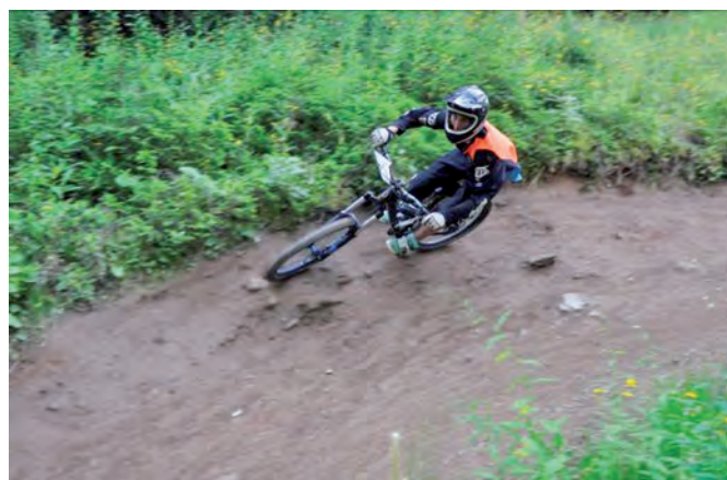
Big Ride 4 Pistes

Les Amateurs de DH se passent le bon plan: prendre le départ de la Big Ride 4 Pistes les 19 et 20 juillet prochains. L'événement «made in Morgins» attire chaque année plusieurs dizaines de fêlés de descente et de sensations fortes, pour le plus grand plaisir des spectateurs!