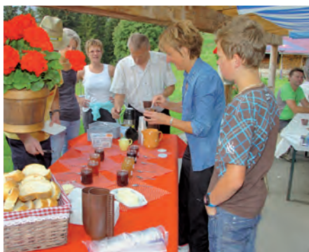
Tartines à l'alpage de Fécon

Des visiteurs venus de toute la Suisse et de la France voisine ont bravé la pluie pour venir apprécier les spécialités et les produits du terroir morginois et de la Vallée d'Illeiez tout au long des haltes gourmandes situées dans le Val-lon de They. L'excellence des produits proposés a fait le bonheur de nos visiteurs. Une valorisation et un encouragement pour nos agriculteurs et leur savoir-faire. Un véritable florilège de saveurs!