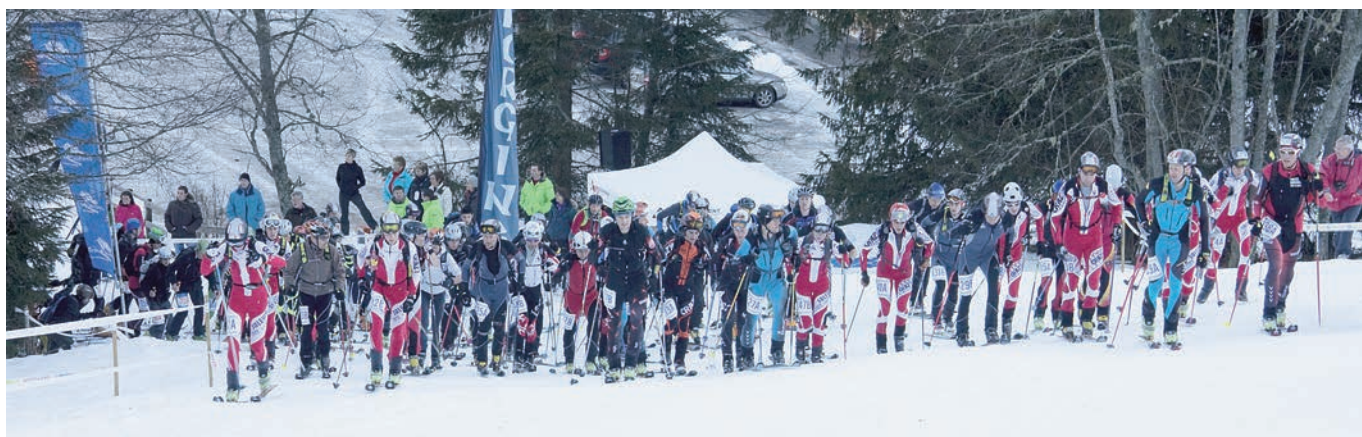
La première édition avait attiré de nombreux concurrents.