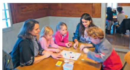
Au chalet de la Treille