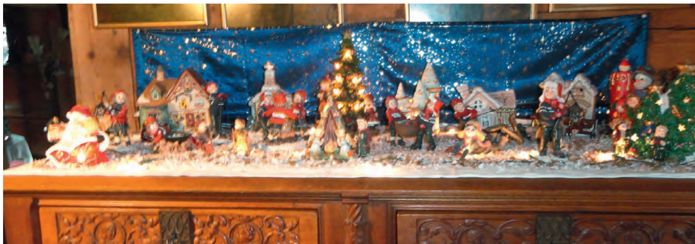
Petite partie de la crèche à admirer de mi-décembre à fin janvier

Voyager pour découvrir des vestiges de la vie passée... regarder sur grand écran les connaissances d'autres mondes... partager grâce à la télévision des collections des plus curieuses, c'est devenu un phénomène de mode malgré les jeux toujours plus informatisés.