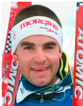
Didier à 21 ans, le début d'une grande carrière