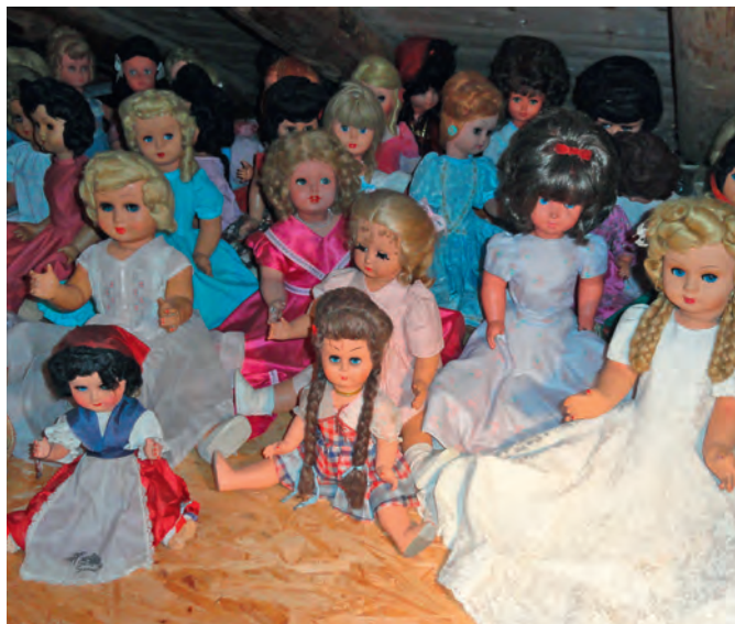
Collection de 300 poupées