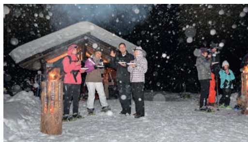
Souvenirs de cette randonnée gourmande qui s'est déroulée sous la neige en 2014

Informations et réservations auprès de Morgins Tourisme