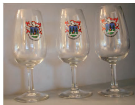
Verre: 21,5 cl et 15 cm de haut