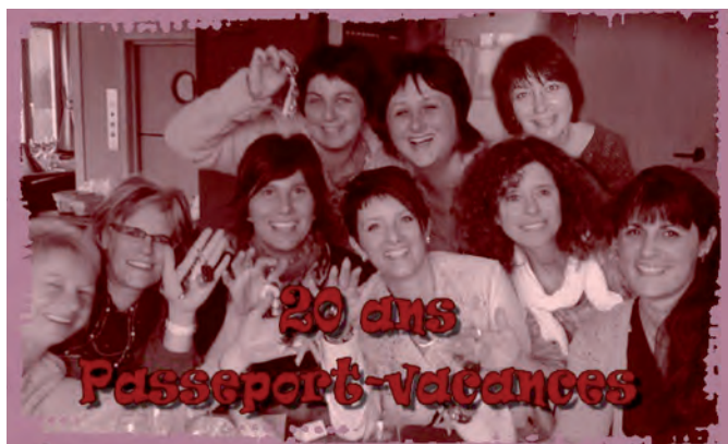
Comité Passeport Vacances 2014

Encore une fois le Passeport-Vacances de Troistorrents-Morgins nous a comblés en proposant une palette variée d'activités toutes aussi intéressantes les unes que les autres. Durant deux semaines, les enfants ont pu découvrir sports, métiers, passe-temps ou balades dans notre jolie région. Vous pouvez dès à présent admirer les photos sur le site www.passeport-vacances.ch . Malgré un soleil qui s'est fait discret, 2014 fut encore une année à marquer d'une pierre blanche; surtout lors de la fête organisée pour les 20 ans. D'Incroyables Talents, tous aussi extraordinaires les uns que les autres, ont osé relever le défi de la scène.