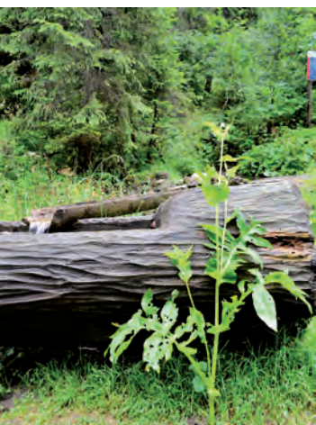
Cirse Maraîcher