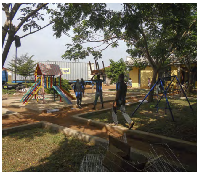
Réception container au Ghana