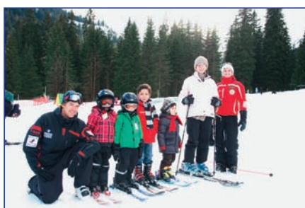
Une journée dédiée aux débutants skieurs et aux amoureux de la neige.

Une journée pour découvrir les joies de la neige et pour s'initier au ski, avec des conseils de professionnels, du matériel de qualité et une piste adaptée aux débutants.