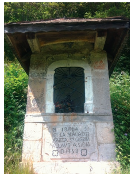
Oratoire de Bas-Thé (commune du Biot) sur le chemin qui mène de la vallée d'Aulps au Val d'Abondance.