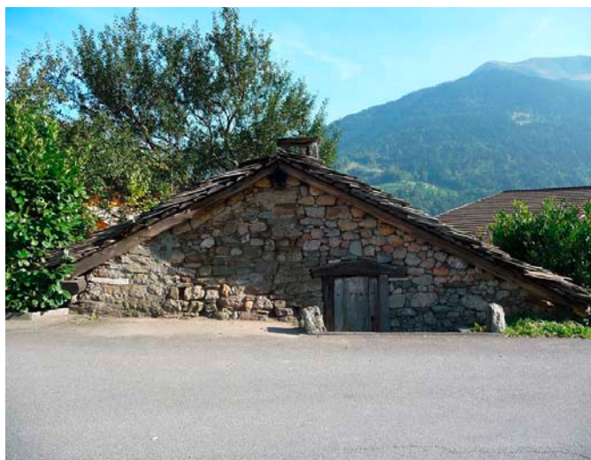
Le four à pain de Propéraz date de 1663.

Restaurer le four à pain du quartier, telle est la mission que s'est fixée l'Association pour la sauvegarde du four à pain de Propéraz (AFAPP). Les actions pour trouver des fonds se poursuivent. Mais les sommes d'ores et déjà récoltées ou promises permettent aujourd'hui de lancer les démarches de restauration. Les travaux de préparation ont débuté cet automne et le début des travaux de restauration du four datant de 1663 est agendé pour le printemps prochain. Un joli cadeau d'anniversaire pour cet édifice qui fête cette année ses 350 ans d'existence!