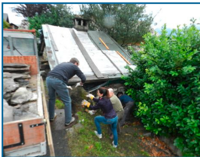
Les travaux de préparation de la restauration du four se déroulent cet automne.