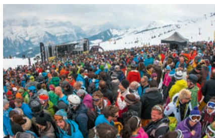
Rock The Pistes 2013 - Caravan Palace à Morgins

Pour la 4 e édition, rendez-vous du 26 au 30 mars 2014 et vivez l'expérience Music & Ski. Chaussez vos skis et rejoignez-nous sur les pistes des PORTES DU SOLEIL!!!