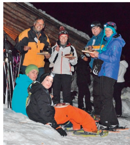
Une Balade gourmande en raquettes à neige

Découvrez les produits du terroir morginois et valaisans au cours d'une randonnée nocturne en raquettes à neige, dans le calme paisible du Vallon de They.