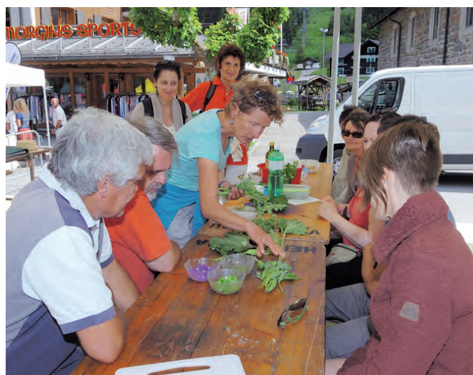
Ateliers pratiques Salon Santé par les Plantes

La 2ème édition du Salon de la Santé par les Plantes assoit Morgins comme une destination à part entière pour découvrir les vertus des plantes sauvages. La fréquentation relevée lors du salon l'atteste, les randonnées thématiques, les ateliers pratiques et les animations ont fait carton plein! Une belle réussite qui présage un bel avenir pour cet événement qui séduit un public sensibilisé par le sujet. Ce salon innovant prend peu à peu sa place dans l'univers du bien-être au naturel. Réservez déjà votre agenda pour la 3ème édition: le 5 juillet 2014.