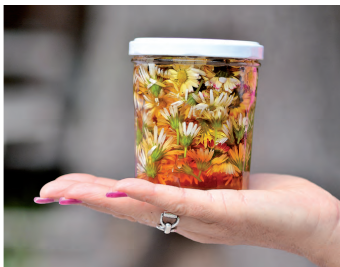
Randonnée thématique cueillette et préparation d'un macérât/élixir aux plantes

La 2ème édition du Salon de la Santé par les Plantes assoit Morgins comme une destination à part entière pour découvrir les vertus des plantes sauvages. La fréquentation relevée lors du salon l'atteste, les randonnées thématiques, les ateliers pratiques et les animations ont fait carton plein! Une belle réussite qui présage un bel avenir pour cet événement qui séduit un public sensibilisé par le sujet. Ce salon innovant prend peu à peu sa place dans l'univers du bien-être au naturel. Réservez déjà votre agenda pour la 3ème édition: le 5 juillet 2014.