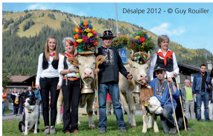
Désalpe 2012

L'automne arrive, le temps pour les troupeaux de redescendre en plaine. La 10 ème édition de la Désalpe vous propose une journée riche de partages et de saveurs. L'occasion aussi de rencontrer la majeure partie des alpagistes morginois et de déguster les bons produits de notre terroir. Sur place différents exposants viennent également vendre leur savoir-faire. Un menu spécial est proposé et un service de buvette est à disposition du public. Rendez-vous le 5 octobre sur la Place du 6 Août pour fêter les 10 ans de cette belle tradition!