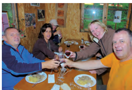
Cantine de They - Polenta et sa broche - © David Hodder

Si vous aussi vous vous sentez d'attaque ne manquez pas le Rallye du Goût, version hivernale de cette balade gourmande qui aura lieu le 1er Février 2014, en attendant la 6ème édition de Goûts du Terroir au Fil de l'Eau aura lieu le samedi 23 août 2014.