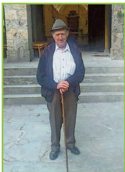
Pour ses 90 ans, un désir réalisé le 8 juin 2013: se rendre à la chapelle du Scex.