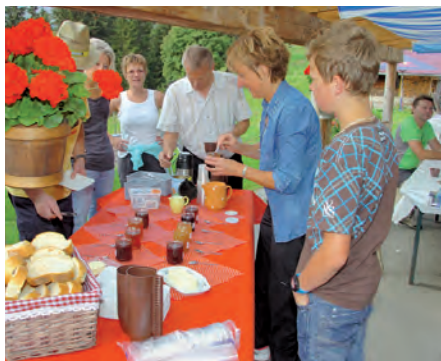
Tartines à l'alpage de Fécon

Des visiteurs venus de toute la Suisse et de la France voisine ont bravé la pluie pour venir apprécier les spécialités et les produits du terroir morginois et de la Vallée d'Illeiez tout au long des haltes gourmandes situées dans le Val-lon de They. L'excellence des produits proposés a fait le bonheur de nos visiteurs. Une valorisation et un encouragement pour nos agriculteurs et leur savoir-faire. Un véritable florilège de saveurs!