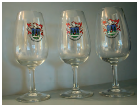
Verre: 21,5 cl et de 15 cm de haut